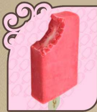
Morango com leite condensado

Feito por quem ama, para quem ama amendoim