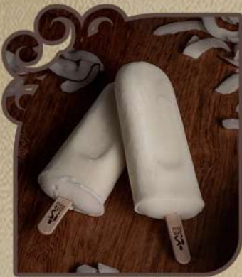
Maracujá com erva doce

Feito por quem ama, para quem ama amendoim