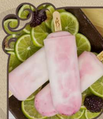
Limonada com amora