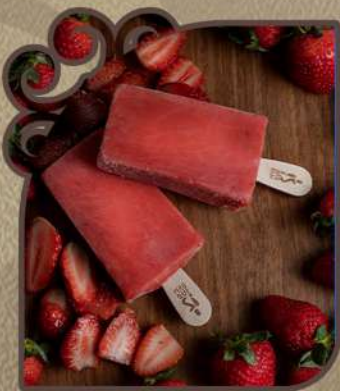
Morango com manjeriço