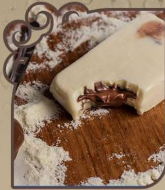
Ninho com nutella