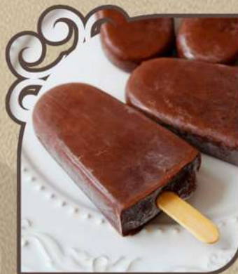
Cacau zero açúcar