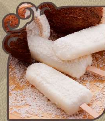
Coco zero açúcar

Base de leite de coco com pedaços da fruta